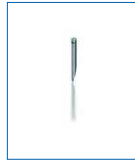
Końcówka 12 mm Nr kat.: 101-040-120-E Klejona (istniejące ramię jest wymagane)